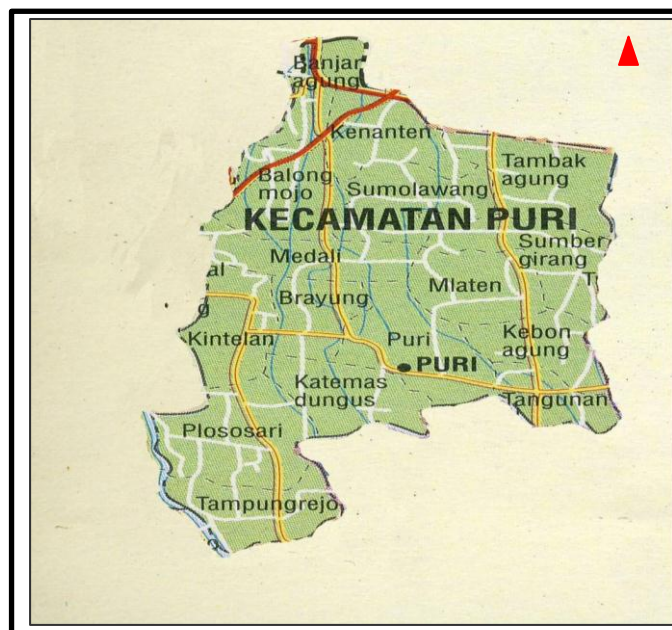
PETA WILAYAH KECAMATAN PURI